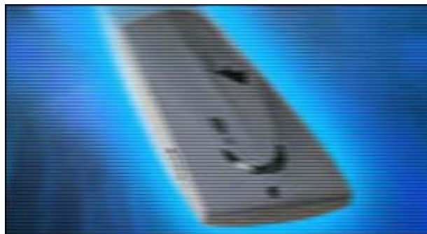
Anonym Surfen

Mit dem "StealthSurfer" – einem USB-Stick mit integriertem Web-Browser – bleiben Surfspuren geheim.